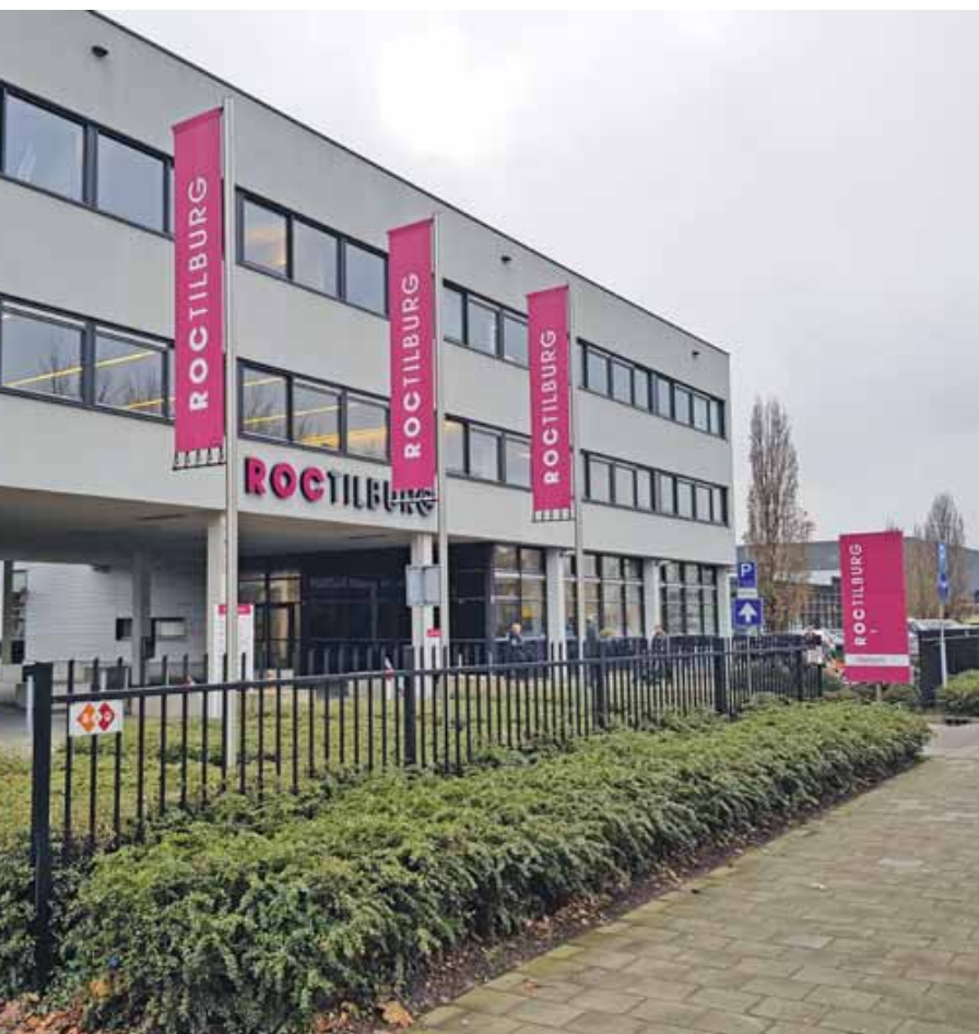
Het gebouw van ROC Tilburg, één van de onderwijsinstellingen behorende tot Onderwijsgroep Tilburg.

H oe zorg je voor optimale veiligheid op een locatie waar een of meerdere